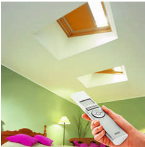
Elektrische Bedienung mit VELUX INTEGRA®

Weitere Informationen erhalten Sie unter www.velux.de